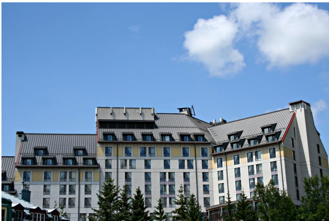
Le Fairmont, haut lieu de compétition