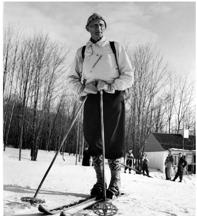
Herman Smith-Johannsen (Jackrabbit) au Mont-Habitant, vers 1955

Smith-Johannsen inscrit définitivement son nom dans l'histoire quand le gouvernement du Québec crée, en 1981, la réserve écologique des Laurentides dont l'appellation sera modifiée en 1992 en l'honneur de l'athlète. Depuis, la réserve écologique Jackrabbit occupe une superficie de 750 hectares entre Ste-Agathe-des-Monts et Huberdeau dans le but d'assurer la protection des écosystèmes représentatifs, entre autres, de la région écologique des Basses Laurentides, laquelle appartient au domaine de l'érablière à bouleau jaune, une appellation très contrôlée.